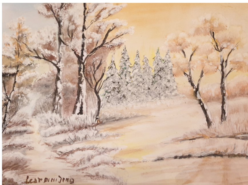
tableau: Leardini Jeng